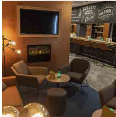
ibis styles Bamberg Lange Straße 29 96047 Bamberg