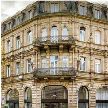
Hotel National Luitpoldstraße 37 96052 Bamberg

Folgende Hotels stehen Ihnen zur Auswahl: