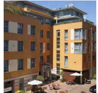
Best Western Hotel Bamberg Luitpoldstraße 7 96052 Bamberg

Telefon +49 (0)951-510900 Fax: +49 (0)951 51090590 info@hotel-bamberg.bestwestern.de